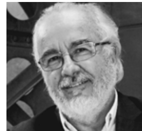
Director ARTURO NAVARRO