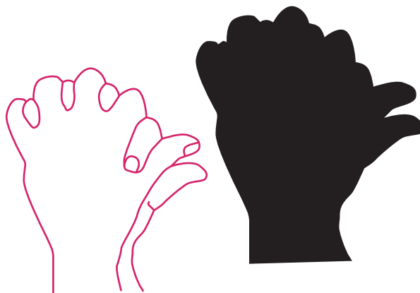
FIGURA 4: CISNE